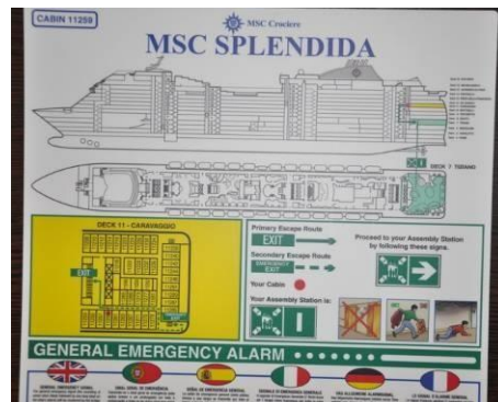
圖示：救生通告和指引（船艙房門背後）

根據國際海事公約(International Convention of Safety of life at Sea (SOLAS)), 所有客輪於啟航前必須進行安全演習, 公約規定所有船上旅客及船員必須出席安全演習。根據廣播和工作人員的指引, 請您攜帶救生衣 (通常放置於衣櫥內), 前往指定集合點 (Muster Station), 參與安全演習。所有船艙內均放置有救生指南, 船艙房門反面標有救生通告和指引, 請您仔細閱讀有關內容。